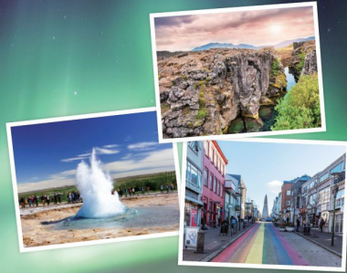
上: シンクヴェトリル国立公園(アイスランド) 左: 間欠泉(アイスランド) 右: レイキャビクの街並み(アイスランド)