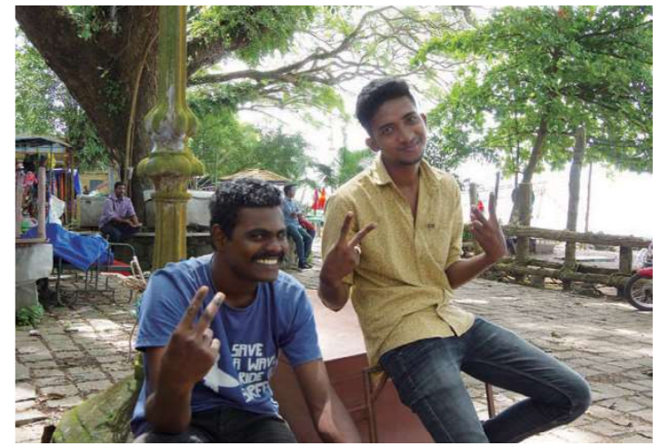
“英語で”話してみよう(イメージ)