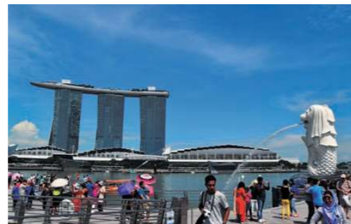
マーライオン公園

※入国審査のため、ツアーの集合時刻は10:00~12:00頃を予定しています。 ※昼食は14:30~15:00頃の開始となる場合があります。