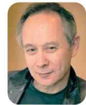
ピーター・バラカン プロードキャスター

言葉というものは、当たり前なことかも知れませんが、意思の疎通を図るための道具です。つまり、相手に通じなければ役に立たないといえます。まじめに構えずに完璧な英語を目指すよりもむしろ簡単な単語を素朴に並べながら自分の気持ちを真剣に伝えようとする方が効果的な場合が多いかと思えます。ただ、カタカナ発音の英語が通じないという事実を認識することは大切です。