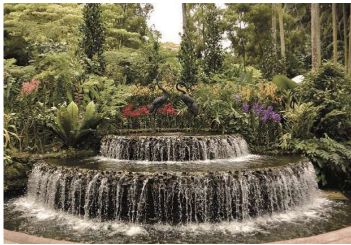
シンガポール植物園(イメージ)