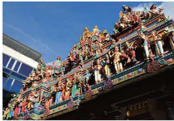
スリ・ヴィラマカリヤマン寺院(リトルインディア)