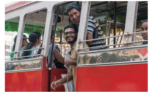
街歩きも楽しみ(イメージ)

多言語国家インドで人びとを繋いでいるのが英語です。ここでは、そんな“コミュニケーションツール”(道具)としての英語にふれてみましょう。地元の人たちと英語を使って交流し、コーチンの街歩きを楽しむ、忘れられない体験となるでしょう。