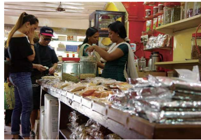
地元の人たちと(イメージ)